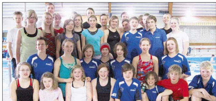
Medaillensammler: Die SG Beckum kehrte mit „schwerem Gepäck“ aus Ennigerloh zurück.